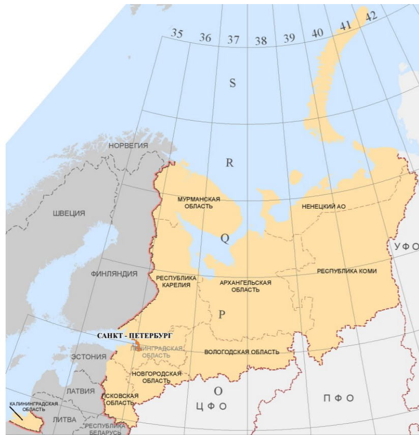
Схема расположения г. Санкт-Петербург в качестве Субъекта Федерации в составе СЗФО

(по данным территориального органа Федеральной службы государственной статистики по г. Санкт-Петербургу и Ленинградской области: http://petrostat.gks.ru/ на 01.01.2020 г.)