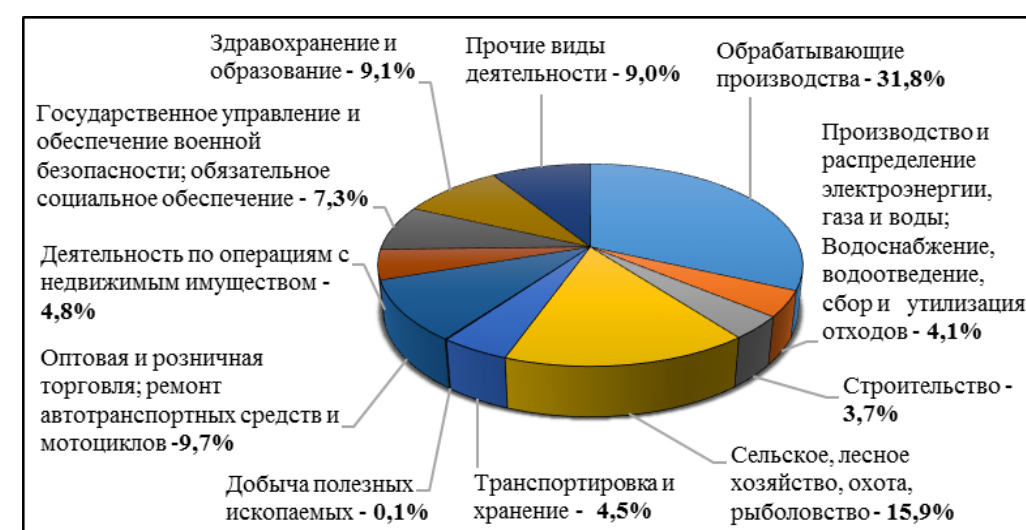
Структура Валового регионального продукта Республики Марий Эл ( www.fedstat.ru )

Структура формирования ВРП республики Марий Эл показана на диаграмме.