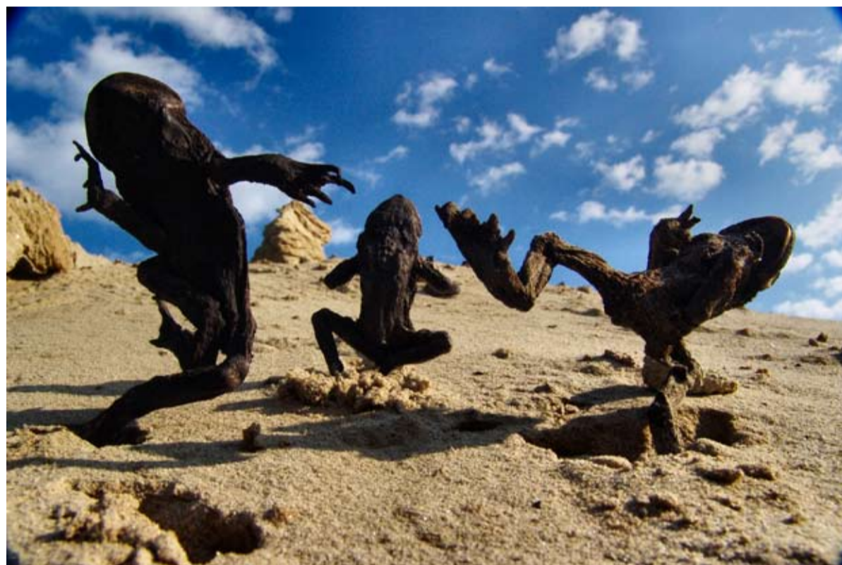
Натюрморт, 181Р Западно-лугинецкого месторождения, Томская область. Автор: Михаил Дронов.