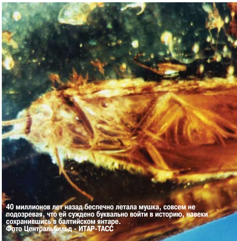
40 миллионов лет назад беспечно летала мушка, совсем не подозревая, что ей суждено буквально войти в историю, навеки сохранившись в балтийском янтаре.

по дереву. Нечто похожее произошло и с костями тюленя, которые нашли на Украине в районе Кривого Рога. Кости оказались железными!